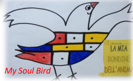
My Soul Bird

La mia rondine dell'anima apre il cassetto della felicità e ... tutto si accende di mille colori brillanti.