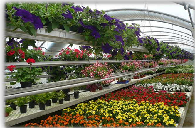
Visita ad un Istituto Superiore