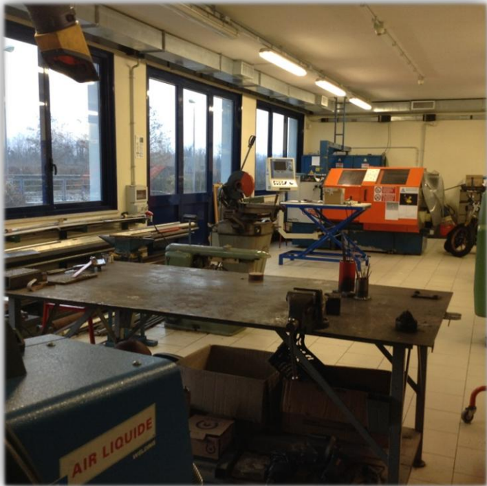
I laboratori di meccanica