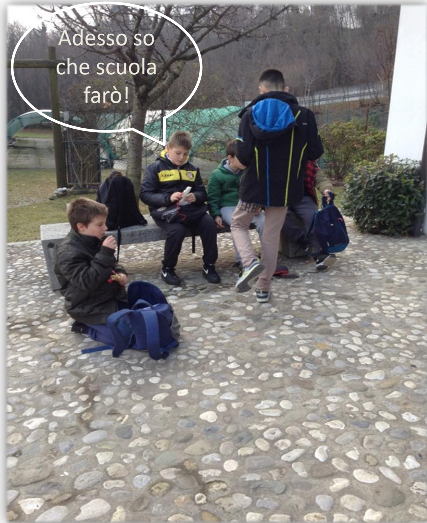
Discussione dopo la visita